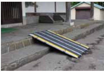
仮設スロープは、正面玄関下足入れ上に常備してあります

車イス用仮設スロープと乗り換え用車イスを購入いたしました。庫裡正面玄関に備え付けてありますので、ご自由にご利用ください。