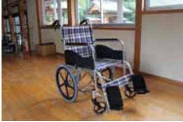
車イスは介助用です